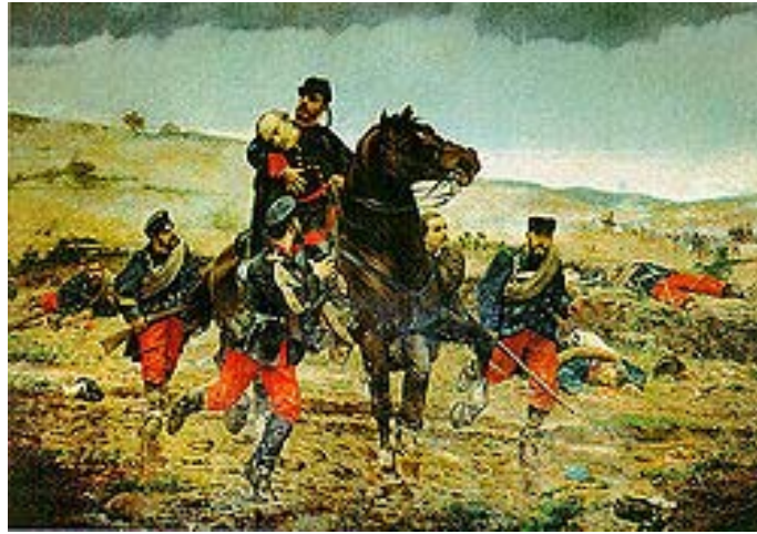
Muerte del Marqués del Duero , por Joaquín Agrasot, pintura de 1884 Actualmente se encuentra en una sala del senado español

En 1847 recibió orden de encabezar una expedición a Portugal para ayudar a mantener el gobierno de la reina María II de Portugal, siguiendo las directrices de la Cuádruple Alianza. Tras haber vencido el 30 de junio de 1847 a las fuerzas septembristas mandadas por el general Francisco Xavier de la Silba Pereira, primer conde das Antas, consiguió restablecer por la fuerza la autoridad de la soberana portuguesa en la ciudad de Oporto. Por ese hecho recibió distinciones honoríficas tanto en Portugal como en España, destacando el marquesado del Duero, con Grandeza de España de primera clase.