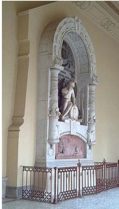
Mausoleo del Marqués del Duero en el Panteón de Hombres Ilustres.

En los preliminares del ataque a Estella, la capital simbólica de los carlistas, una bala le atravesó el pecho durante la batalla de Monte Muro, cerca del pueblo de Abárzuza, en la tarde del 27 de junio de 1874.